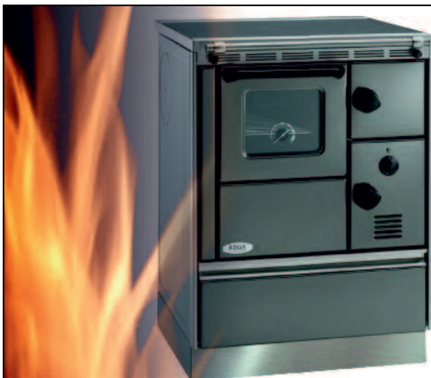
Lohberger Dauerbrandherd Rega 60.4

Wir wünschen Ihnen viel Spaß beim Entdecken der neuen Funktionen unserer Gemeinde-Homepage www.hopfgarten.tirol.gv.at bzw. von GEM2GO ab Mitte Februar 2019.