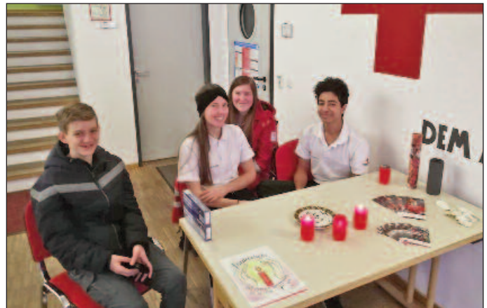
Jugendgruppe beim Weihnachtsmarkt und bei der Friedenslichtausgabe