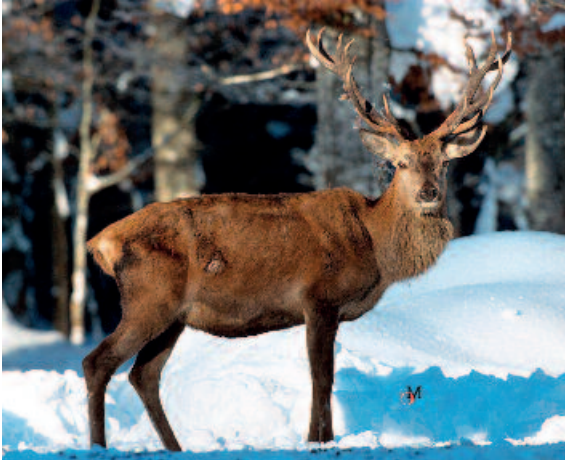
Ein völlig abgemagerter Hirsch nach einem langen Winter