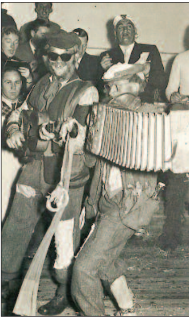
Beim Betriebsrennen-Ball Dummer Fritz und Gasteiger Pedal spielen auf!