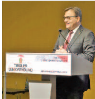
LH Günther Platter bei der Neujahransprache

LH Günther Platter bedankte sich bei den Seniorinnen und Senioren für deren ehrenamtliches Wirken und ihr vielseitiges Engagement. Zum Abschluss spendete Abt Germann Erd noch den Neujahrsegen.