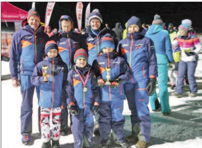
Der SC Kelchsau präsentiert sich mit neuem Outfit