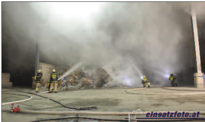
Brand beim DAKA-Lager