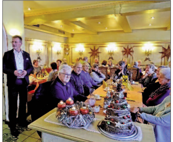
Einen netten Nachmittag verbrachten die Besucher der Weihnachtsfeier