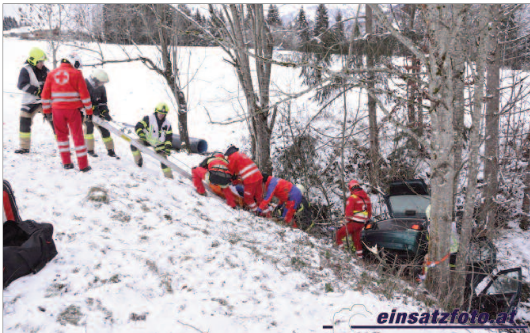
Fahrzeugabsturz am Penningberg