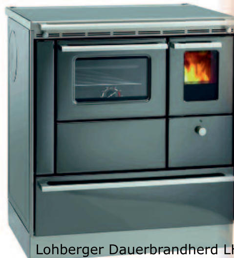
Lohberger Dauerbrandherd LHS 75.4 N

Abmessungen: 60 x 60 x 85 cm (LxBxH) Leistung 7,1 kW Kochfläche Ceran inkl. Herdstange